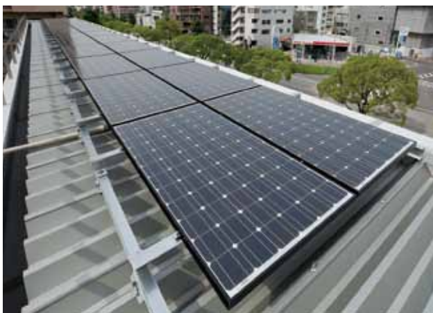
ソーラーパネル(金山支店)